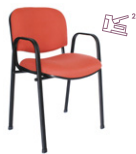
ISO CON BRAZOS