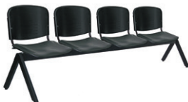
ELLITICO OHR-2600-2P | OHR-2600-3P OHR-2600-3P | OHR-2600-5P